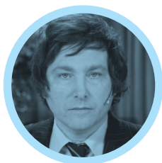
IMAGEN JAVIER MILEI